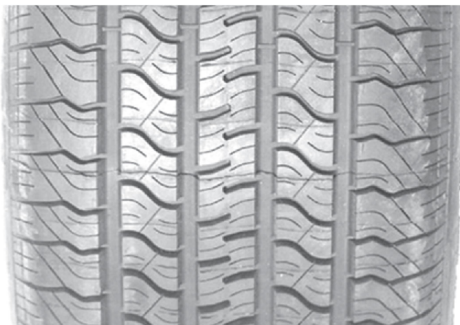
а) Шина P1

Известно, что для шины H1 по крайней мере часть продукции выпущена со сдвигом рисунка протектора, как показано на рисунке 3. Такой сдвиг допустим, если продольные канавки рисунка протектора не заблокированы полностью (хотя тонкий шов между двумя половинами протектора возможен). Шина с протектором, показанным на рисунке 3 а), допустима к применению в качестве шины H1, а шина, показанная на рисунке 3 б) – нет.