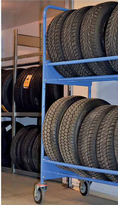
Рисунок В.2 – Пример полок для шин с четырьмя трубками