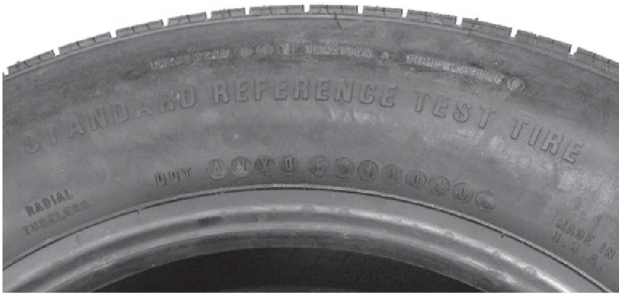
а) Шина P1