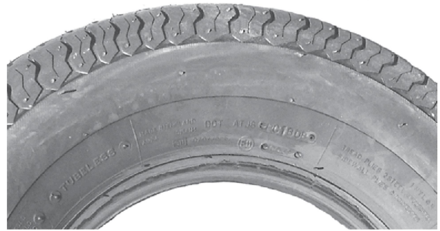
б) Шина H1

Примечание – На боковинах обеих шин указаны их коды, включая время изготовления в формате WWYY. В приложении D дано сопоставление применимости образцовых шин и шин, доступных на рынке, в целях испытаний по ISO 11819-2.