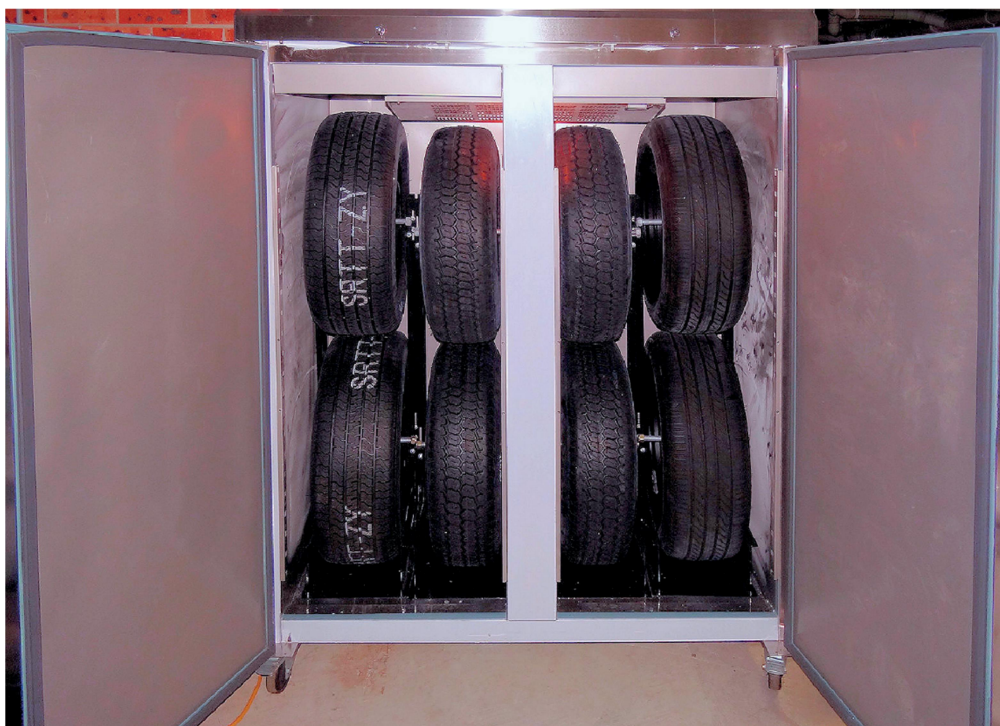
Рисунок В.1 – Пример специального стеллажа для хранения шин (колес в сборе) Р1 и Н1 в холодильном шкафу

Условия длительного хранения (годы): При длительном хранении рекомендуется не устанавливать шины на колеса, а хранить их отдельно в отсутствие натяжений, сжатий и иных деформаций, способных привести к деградации резины вплоть до появления трещин. Шины хранят в вертикальном положении на специальных полках для шин из двух или четырех горизонтальных трубок (см. рисунок В.2). Чтобы предотвратить деформацию, шины рекомендуется регулярно (например, раз в месяц) поворачивать на небольшой угол. Допускается хранить шины на полках в горизонтальном положении, но не более двух друг на друге.