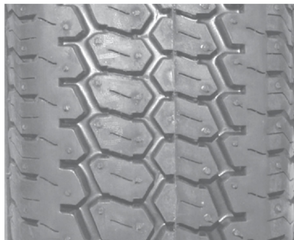
б) Шина H1