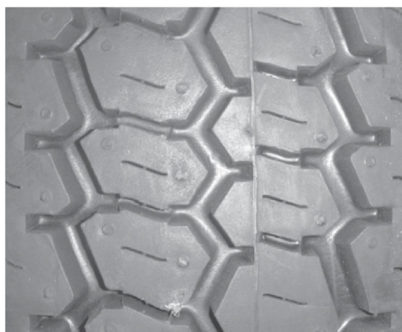
б) Рисунок со сдвигом